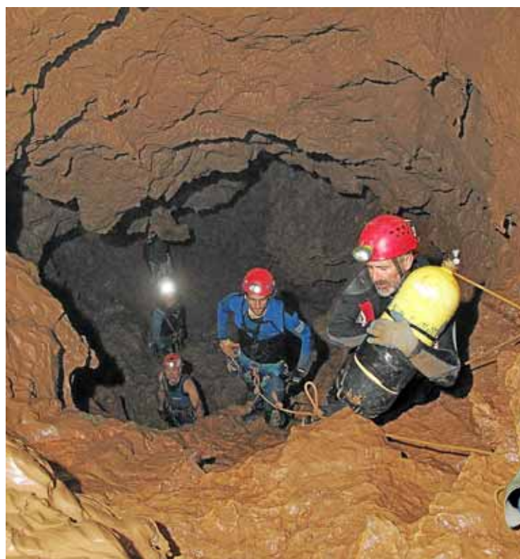
El material de busseig es va haver de transportar fins al final del recorregut realitzant cadenes humanes.

ficientment documentada". És per això que l'agrupació, a través de les tres formacions que la integren -Agrupació Esportiva Voltors, Grup Espeleològic de Llubí i Grup Nord de Mallorca-, va decidir reprendre l'estudi de la cova amb dos objectius: prosseguir la planimetria iniciada als anys 70 i realitzar un reconeixement a fons de tota la cavitat. Els directores tècnics de l'expedició asseguren que "les dificultats han estat molt grans, ja que la mitja tona de material de busseig necessari per fer