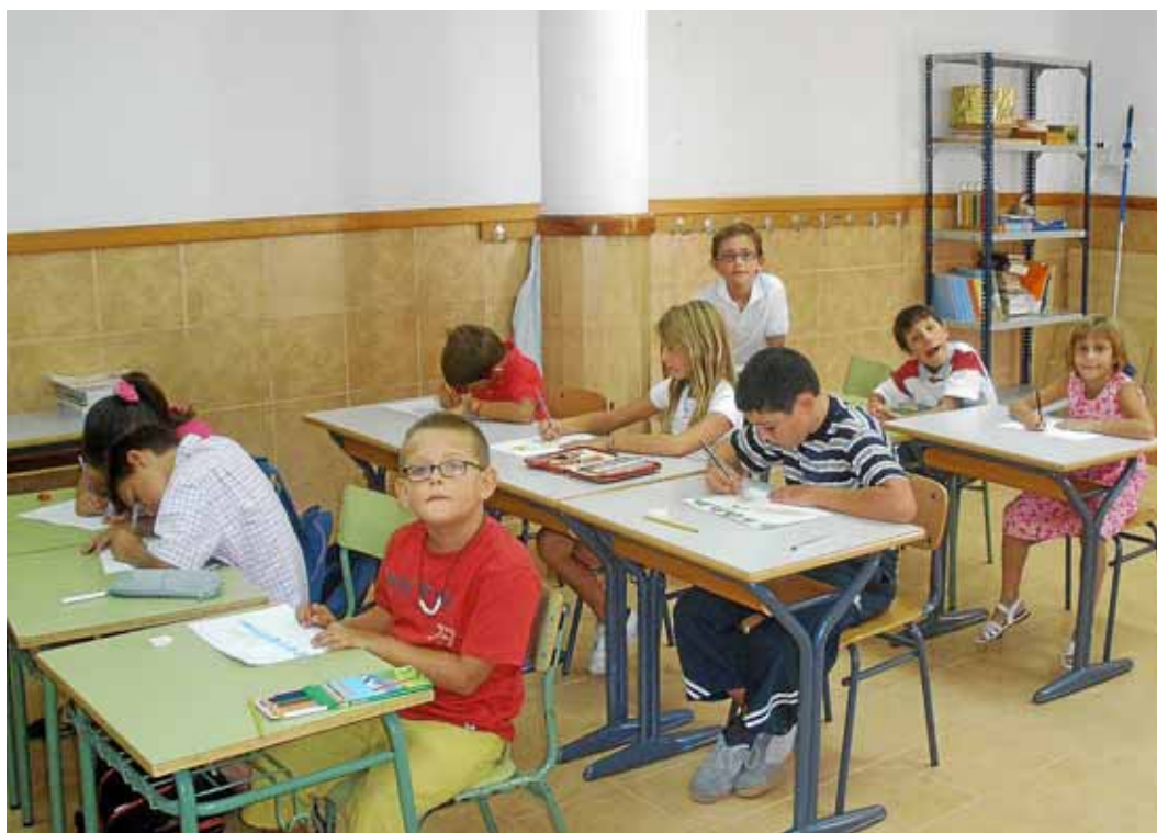
En el centre conviuen 48 al·lots, d'entre 6 i 14 anys, procedents de vuit països diferents.

coneixement d'aquesta important cova hidrològicament activa de la serra de Tramuntana. Aquests treballs es complementaran en el futur amb estudis sobre la fauna, anàlisis dels sediments i altres investigacions".