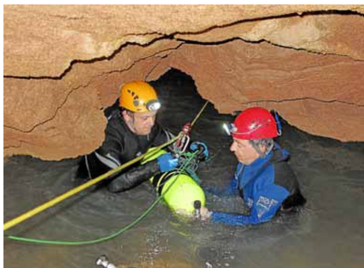
Per garantir la seguretat s'instal·laren cordes fixes en els llacs.

d'agost el volum d'aigua en aquest indret "oscil·lava els 11.500 metres cúbics i la temperatura de l'aigua era de només 14 graus". Gràcia i Croix indiquen que "això només és el principi, ja que ara han de continuar la documentació i el re-