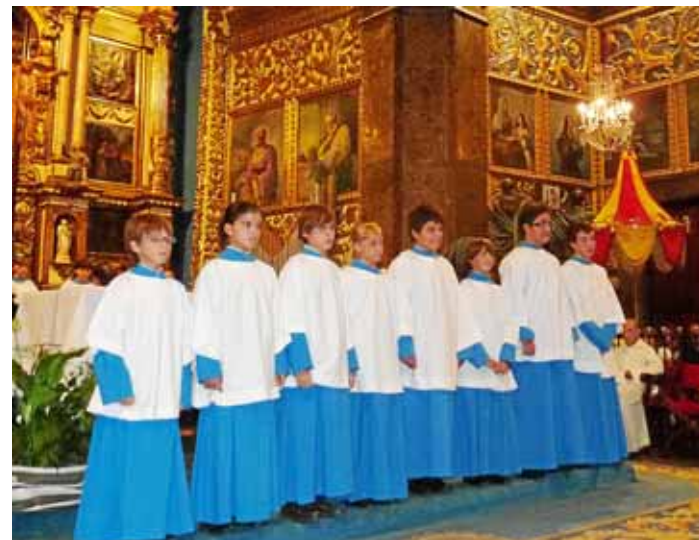
Alguns dels alumnes poden formar part del cor dels Blavets.